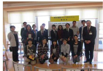
※幸せの黄色いレシートキャンペーン・贈呈式