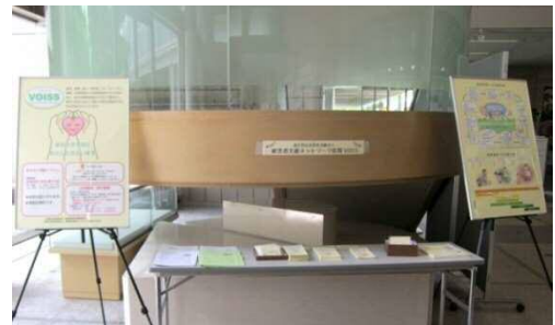
※アバンセ・パネル展示